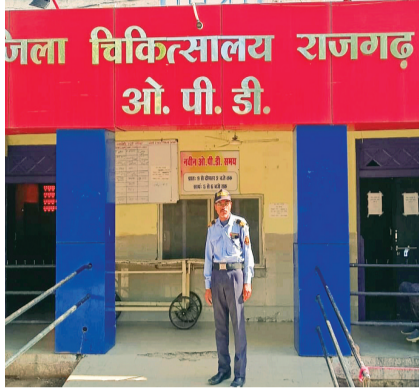
हरिभूमि न्यूज़ | ब्यावरा

सरकार की जनहितैषी स्वास्थ्य योजनाओं को जिम्मेदार लगा रहे चूना, सिविल सर्जन बोले करवाएंगे जांच