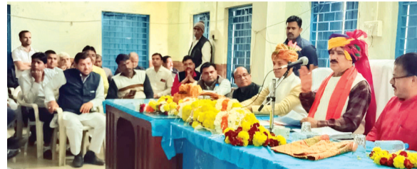
हरिभूमि न्यूज़ | सारंगपुर

जनपद पंचायत में हुई सरपंच संघ की बैठक में मंत्री टेटवाल बोले- विधानसभा के विकास के लिए साथ मिलकर करेंगे कार्य