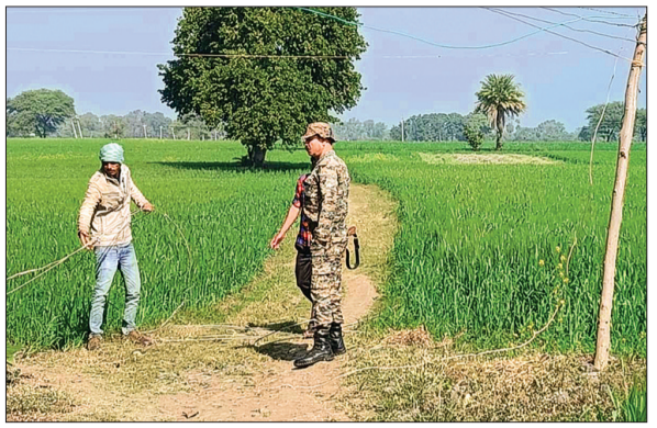
श्यामपुर। अवैध कनेक्शन मिलने पर बिजली कंपनी ने की कार्रवाई।

हरिभूमि न्यूज़ ▶▶ श्यामपुर विद्युत अधिनियम 2003 की धारा 135 के अंतर्गत विद्युत चोरी के प्रकरण दर्ज किया जा रहे हैं। कनेक्शन में अनियमित संबंधी धारा 126 में प्रकरण दर्ज किया जा रहे हैं। बकाया राशि के कारण अस्थायी रूप से विच्छेद लाइन पर जांच में लाइन पर जांच में अवैध रूप से उपयोग पाए जाने पर धारा 138 में प्रकरण दर्ज किया जा रहे हैं। इस कार्रवाई में सीहोर से जांच दल और वितरण के विद्युत बिलों की बकाया राशि का समय पर भुगतान करें व अभियोग कार्यवाही से बचें। बिल वसूली कार्रवाई सतत जारी रहेगी। इस कार्रवाई में इसके अतिरिक्त विद्युत कनेक्शन की सघन जांच की जा रही है। जिसमें अवैध रूप से विद्युत का उपयोग पाए जाने पर उपयोग