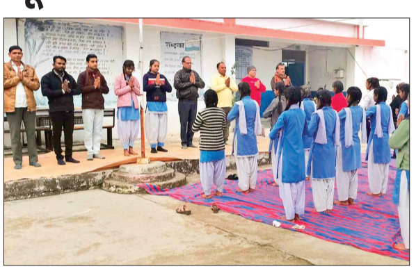
हरिभूमि न्यूज़ ▶▶ जावर

स्वामी विवेकानंद की जयंती 'युवा दिवस' के अवसर पर जावर सहित पुरे जिलेभर में योग कार्यक्रम का आयोजन किया गया। सुबह सभी स्कूलों में विद्यार्थियों ने योग और सूर्य नमस्कार किया। यही नियमित योग साधकों ने घर और गार्डन में शांकर योग किया। इसके साथ ही शांकर योग हई स्कूल कजलास में 12 जनवरी 2024 को सूर्य नमस्कार कार्यक्रम आयोजित किया गया